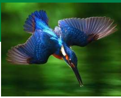
Elementverdeling Marijke Konings